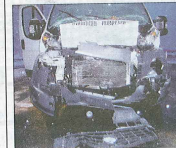
Der Lieferwagen erlitt grossen Schaden.

Am Dienstagmorgen, 16. November, fuhren ein Lastwagen mit Luzerner Kontrollschildern und ein niederländischer Lieferwagen auf der Autobahn A2 in Wassen Richtung Süden. Bei der Dosierstelle schaltete die Lichtsignalanlage verkehrsbedingt auf Rot. Aus diesem Grund hielt der Lastwagenlenker sein Fahrzeug vor der Ampel an. Der hinter ihm fahrende Lenker des Lieferwagens wurde von der Situation überrascht und prallte gegen das Heck des Lastwagens. Der Lastwagenlenker verletzte sich bei diesem Unfall und wurde mit der Ambulanz ins Kantonsspital Uri überführt. Der Sachschaden der beiden Fahrzeuge beläuft sich insgesamt auf zirka 35 000 Franken. (Kapo)